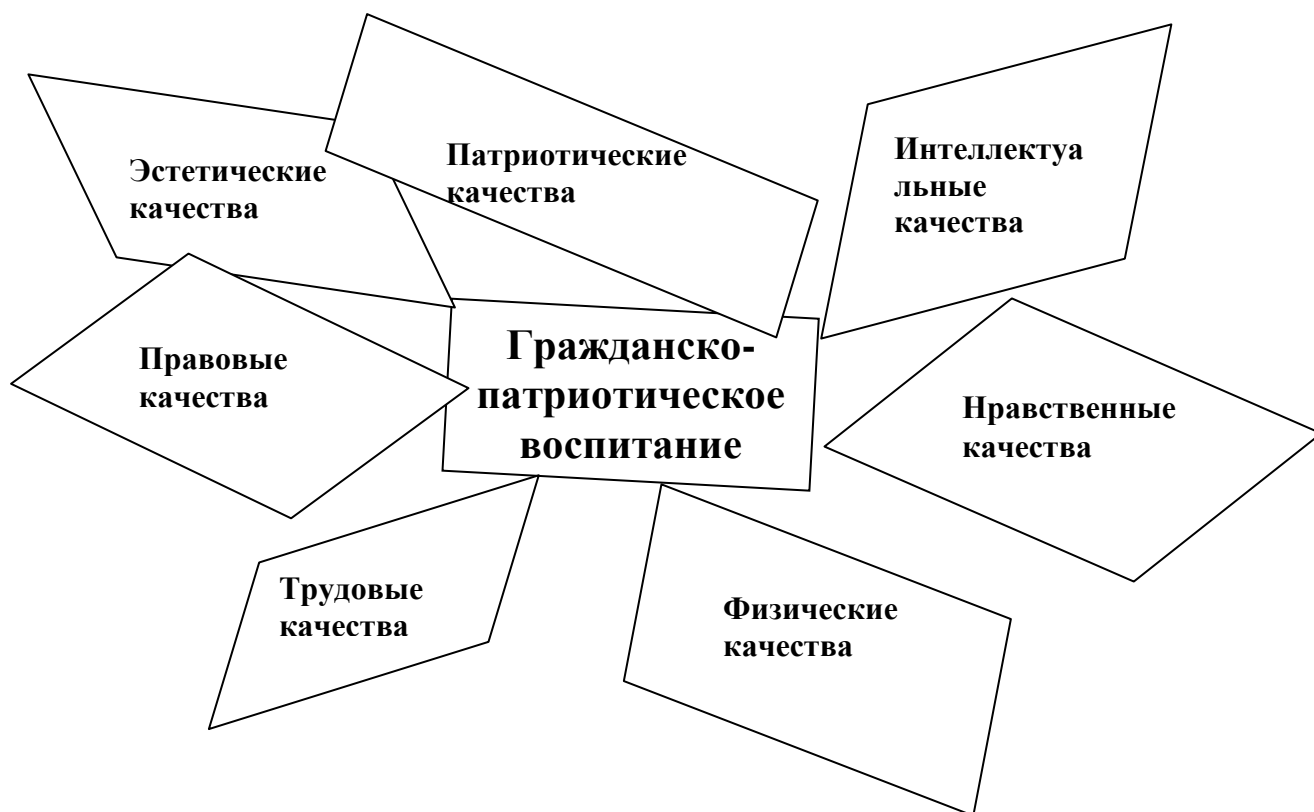
Рис. Гражданско-патриотическое воспитание

Таким образом, гражданско-патриотическое воспитание оказывает влияние на все сферы социальной жизни учащихся и, следовательно, на социально-психологическую структуру личности. Наиболее существенные из них те мировоззренческие убеждения и гражданско-патриотические качества, которые определяют отношение учащихся к своим гражданским обязанностям. Если рассматривать структуру гражданско-патриотического воспитания как совокупность качеств личности, подлежащих формированию, то она будет выглядеть следующим образом ( рисунок )